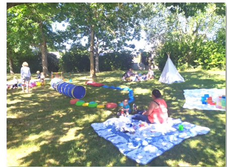
Matinée d'éveil à Saint-Herblon le 5 juillet