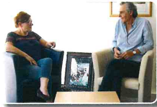
Un travail d'équipe

La personne accueillie est toujours considérée comme hospitalisée et reste sous la responsabilité du Centre Hospitalier.